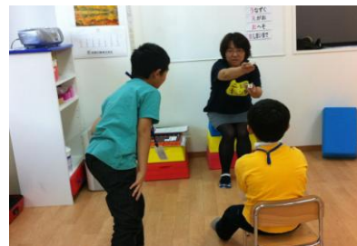
ことばキャンプでの利用シーン

当社は、「キューブキッズ・アンバサダー」に認定された団体／教育機関へRSCを送付します。認定団体様には、公式サイトやフェイスブックページを通して、RSCのさまざまな使い方や感想、楽しんでいる写真などを広く発信していただきます。 本活動を通して、子どもたちの創造性や感性を伸ばす機会を創出し、「社会を生き抜く力」を培う教育への貢献 を目指します。